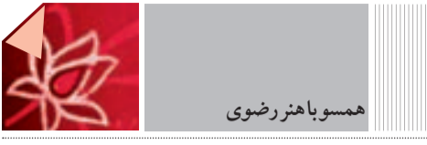
همسو با هنر رضوی